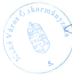
Farkas Éva Erzsébet polgármester