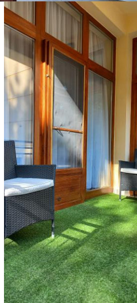
és a bejárat...