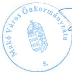
Farkas Éva Erzsébet polgármester