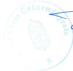
Farkas Éva Erzsébet polgármester