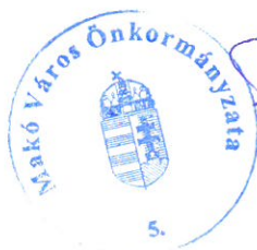
Farkas Éva Erzsébet polgármester