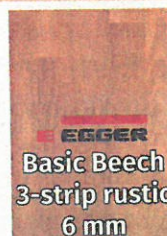
EGGER Basic Beech 3-strip rustic 6 mm