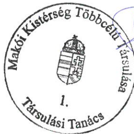
Farkas Éva Erzsébet a Társulási Tanács Elnöke