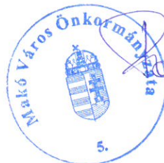
Farkas Éva Erzsébet polgármester