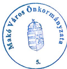
Farkas Éva Erzsébet polgármester