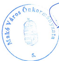
Farkas Éva Erzsébet polgármester