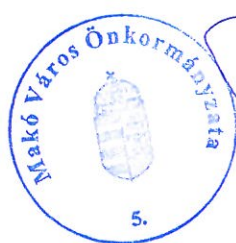
Farkas Éva Erzsébet polgármester