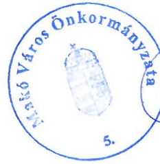
Farkas Éva Erzsébet polgármester