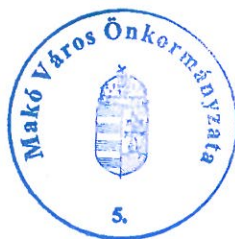
Farkas Éva Erzsébet polgármester