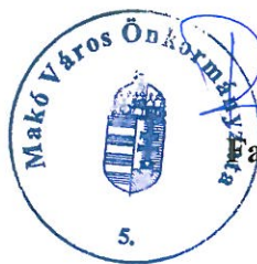
arkas Éva Erzsébet polgármester