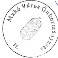
Farkas Éva Erzsébet polgármester