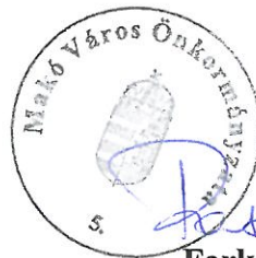
Farkas Éva Erzsébet polgármester